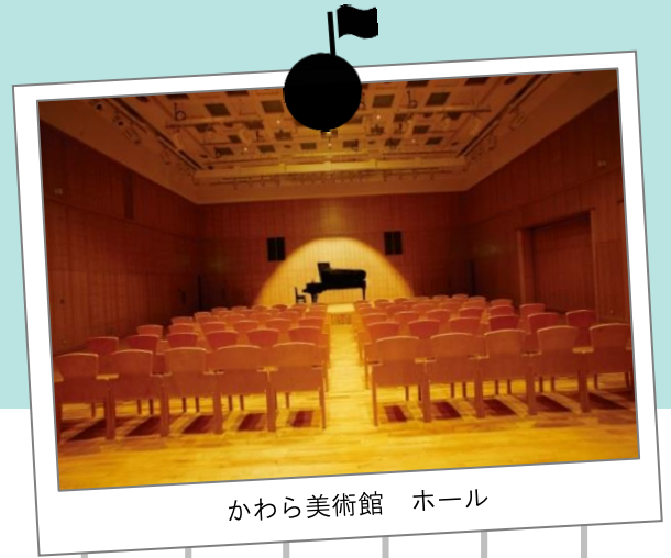
かわら美術館 ホール